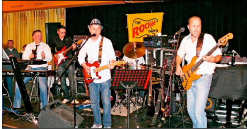
Die älteste Badener Rockband «The Rock 66 Band»